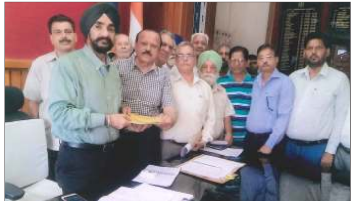
Members of the Govt. Pensioners Association Ferozepur handing over the memoranda of demands of Senior Citizen's to DC Ferozepur