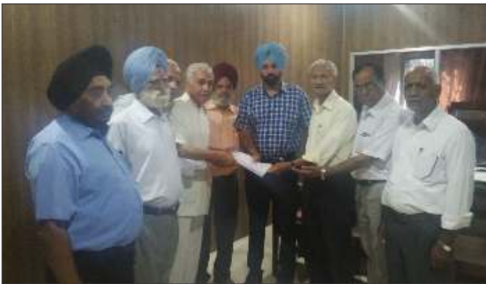
Members of the Senior Citizens Welfare Council Khanna handing over Memoranda of demands of Senior Citizen's to SDM Khanna