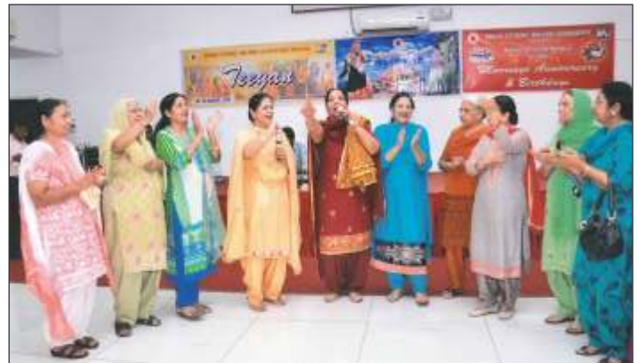
Ladies presenting Gidha on occasion of family get-to-gether of Senior Citizen Welfare Association Ludhiana