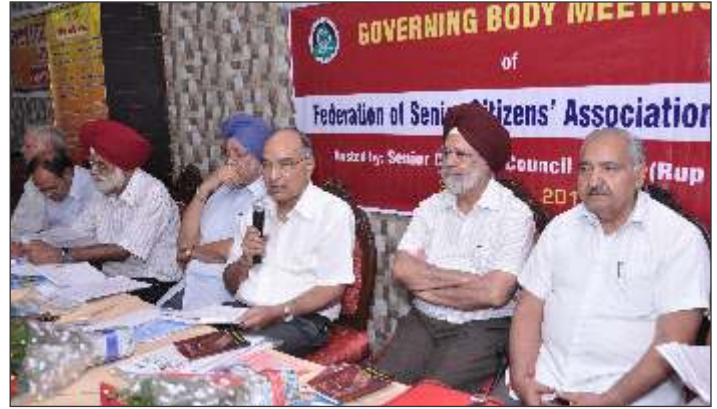
Meeting of Governing Body in Progress at Roop Nagar