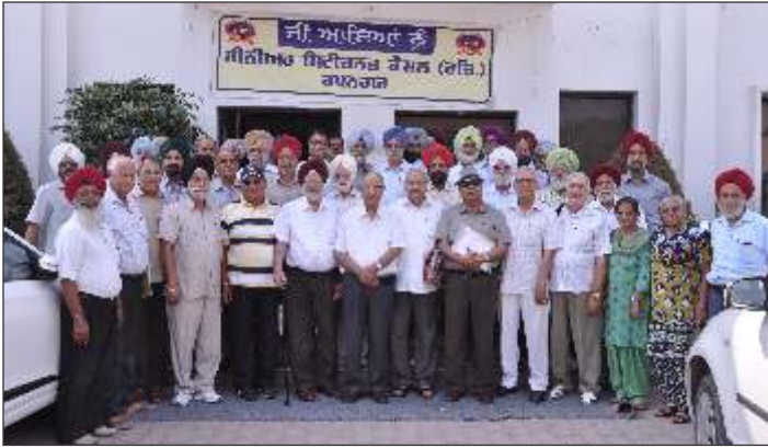
Members of The Governing Body of Fedsen Punjab at Roop Nagar