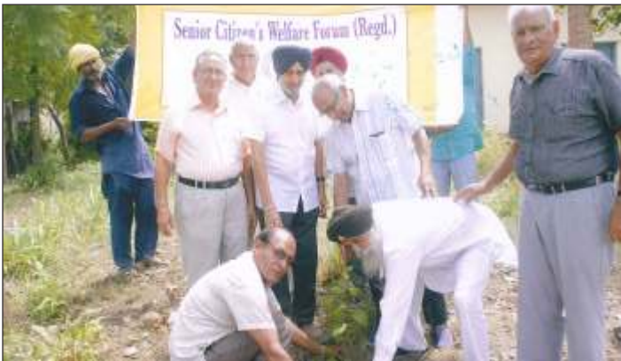
Members of Senior Citizens forum (Regd.) Jagraon planting a sampling to celebrate Van Mahotsava