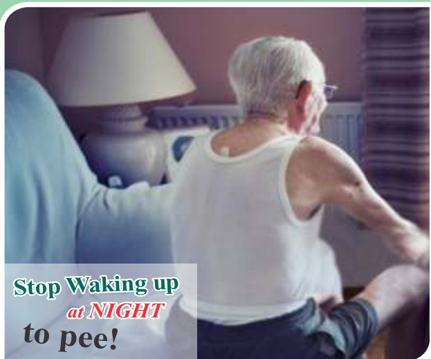
Stop Waking up at NIGHT to pee!

Sherpur Chowk, G.T. Road, Ludhiana-141 003, Ph: + 91-161-6617111, 6617222, web site: www.spshospitals.com , e-mail: info@spshospitals.com