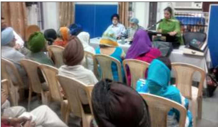
Members of Senior Citizen's Council Mohali enjoying the Cultural Programme