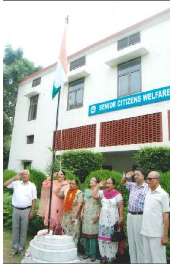
Independence Day being celebrated by Senior Citizen's Welfare Council Nabha