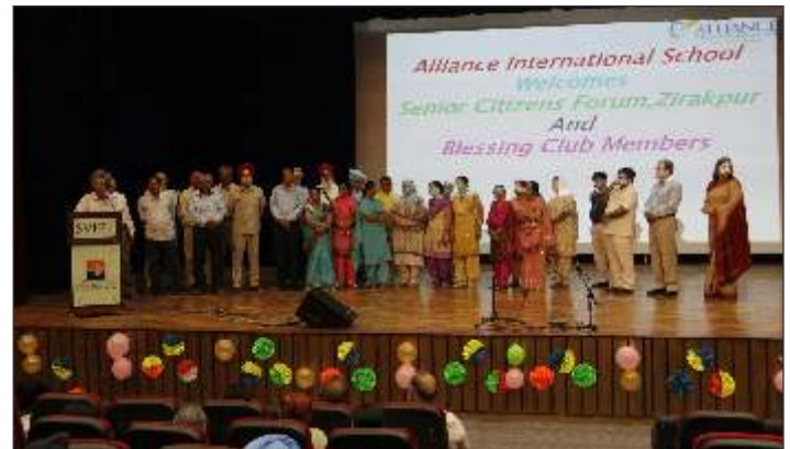
Members of Senior Citizen's Forum with students of Alliance International School Banur to celebrate Dada Dadi Nana Nani Day